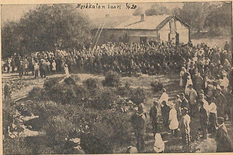
In der Heimat des finnischen Erweckungsprebigers Paavo Ruotsalainen,