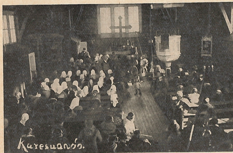
Das Innere der Kirche in Kareisuanbo, von wo aus die Erweckungsbewegung unter Lars Levi Laestadius ihren Ausgang nahm.