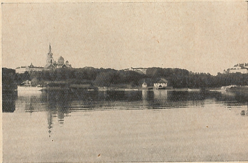
Kloster Balamo (Finnland)